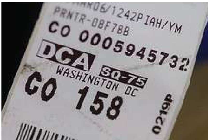
Figura 1: Etiqueta de equipaje